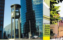
5 Potsdamer Platz