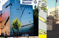
6 Jüdisches Museum