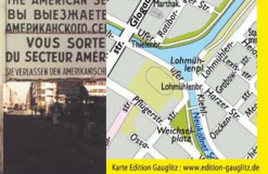
7 Checkpoint Charlie

Bus Verkehr Berlin KG Grenzallee 15 12057 Berlin, Germany Tel.: +49 (30) 68 38 91 0 Fax: +49 (30) 68 38 91 50 www.bvb.net E-Mail: contact@bvb.net